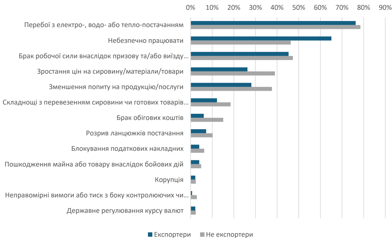
Рисунок 3: Перешкоди діяльності бізнесу, % (дозволяється кілька відповідей)