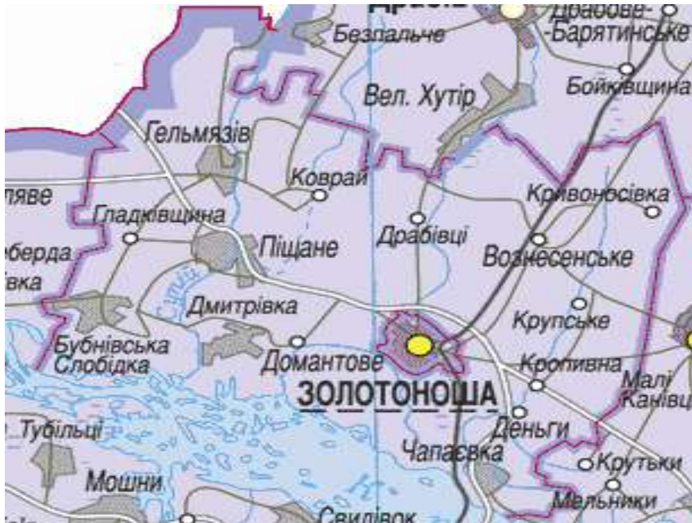
Рис. 4.3. Місцезнаходження м. Золотоноша

Високий ступінь зношеності основних фондів у промисловості (від 40 % до 90 %) призводить до зниження конкурентоспроможності продукції на внутрішньому та зовнішньому ринках. Водночас, на території м. Золотоноша залишаються незадіяними площі, що можуть бути потенційним резервом для нарощування промислового потенціалу міста.