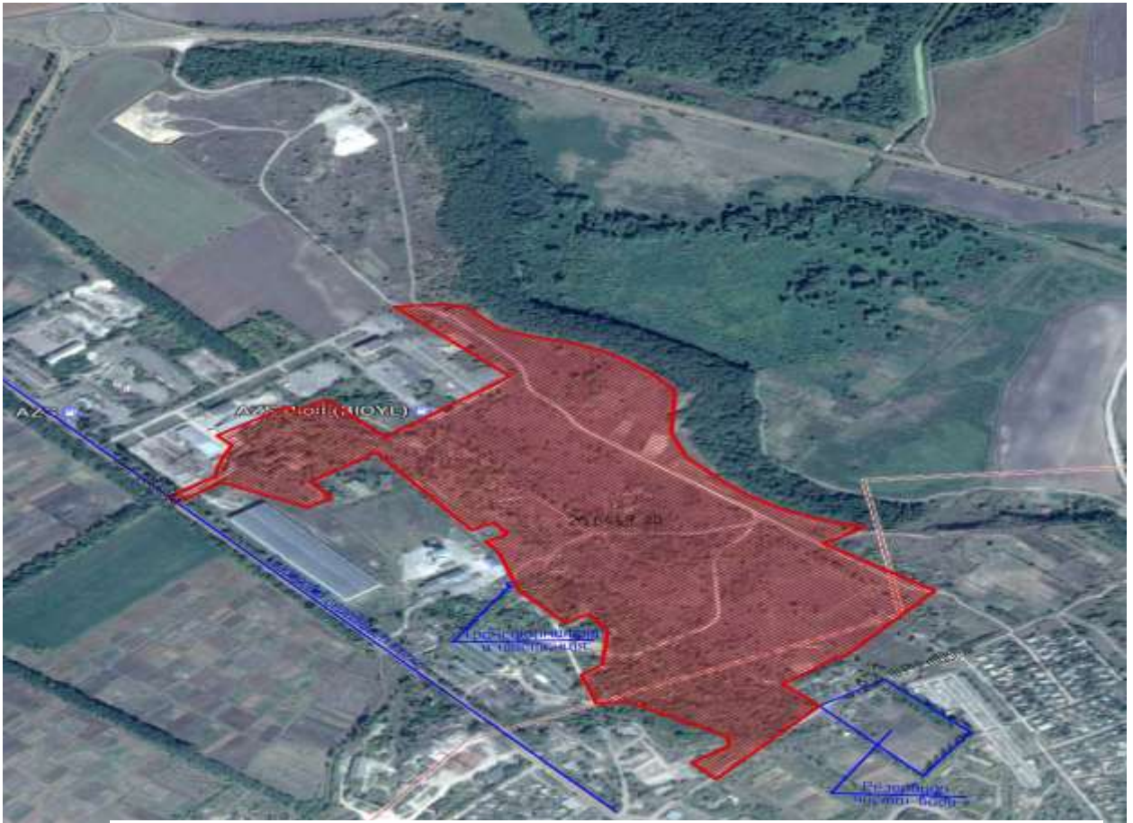
Рис. 4.4. Місце розташування індустріального парку на території м. Золотоноша (схематично)

Загальна площа індустріального парку становить 39,9285 гектарів (надалі 39,93 га).