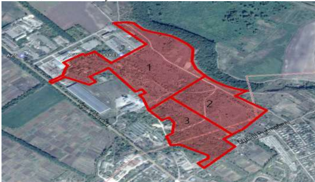
Рис. 8.2 Розподіл території на ділянки

може бути розглянутий продаж кількох ділянок одному інвестору з подальшим їх об'єднанням у крупнішу ділянку для розміщення більш потужних об'єктів. При цьому зворотна ситуація – коли дроблення ділянок на менші за площею не допускається, оскільки площа ділянки 2-3 га є фактично мінімальною для розміщення повноцінного виробничого чи складського об'єкту.