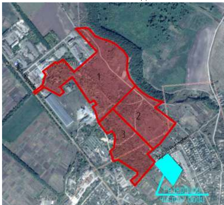
Рис. 4.8 Водопостачання індустріального парку

На відстані 200 метрів від ділянки розташована точка підключення до системи водопостачання (резервуар чистої води). Існуючих потужностей недостатньо для забезпечення парку водою. На момент розробки Концепції йде реконструкція резервуару чистої води, який буде збільшено до 2,5 тис. куб. м. Але враховуючи потреби міста в водозабезпеченні (1,5-2 тис. куб. м на добу) та максимальні об'єми підняття води на Домантовському водозаборі, необхідно ще додаткове буріння двох свердловин, які забезпечать III технічною водою.