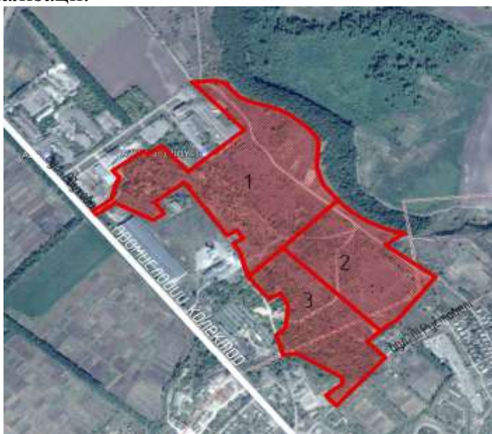
Рис. 4.9. Водовідведення та каналізація

На відстані 300 метрів від межі ділянки проходить колектор промислової каналізації.