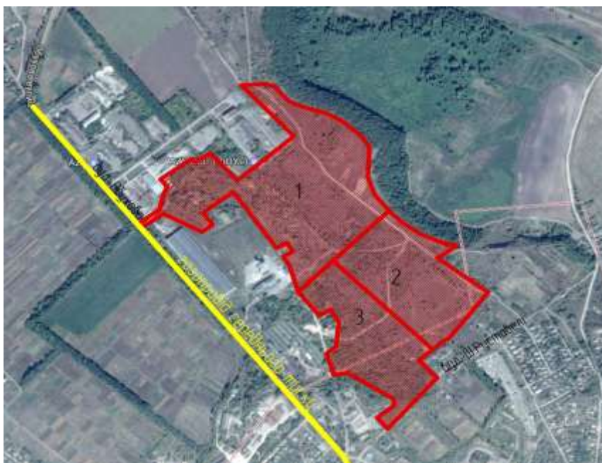
Рис. 4.6. Газопостачання