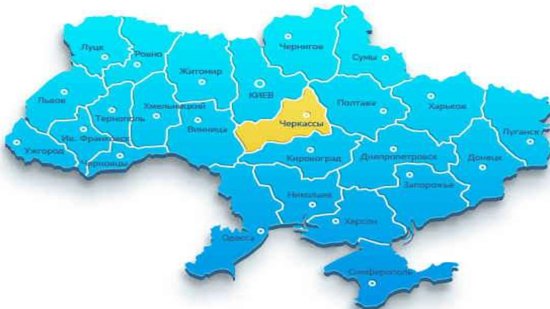
Рис. 4.1 Черкаська область

Дана Концепція описує створення індустріального парку на території м. Золотоноша Черкаської області.