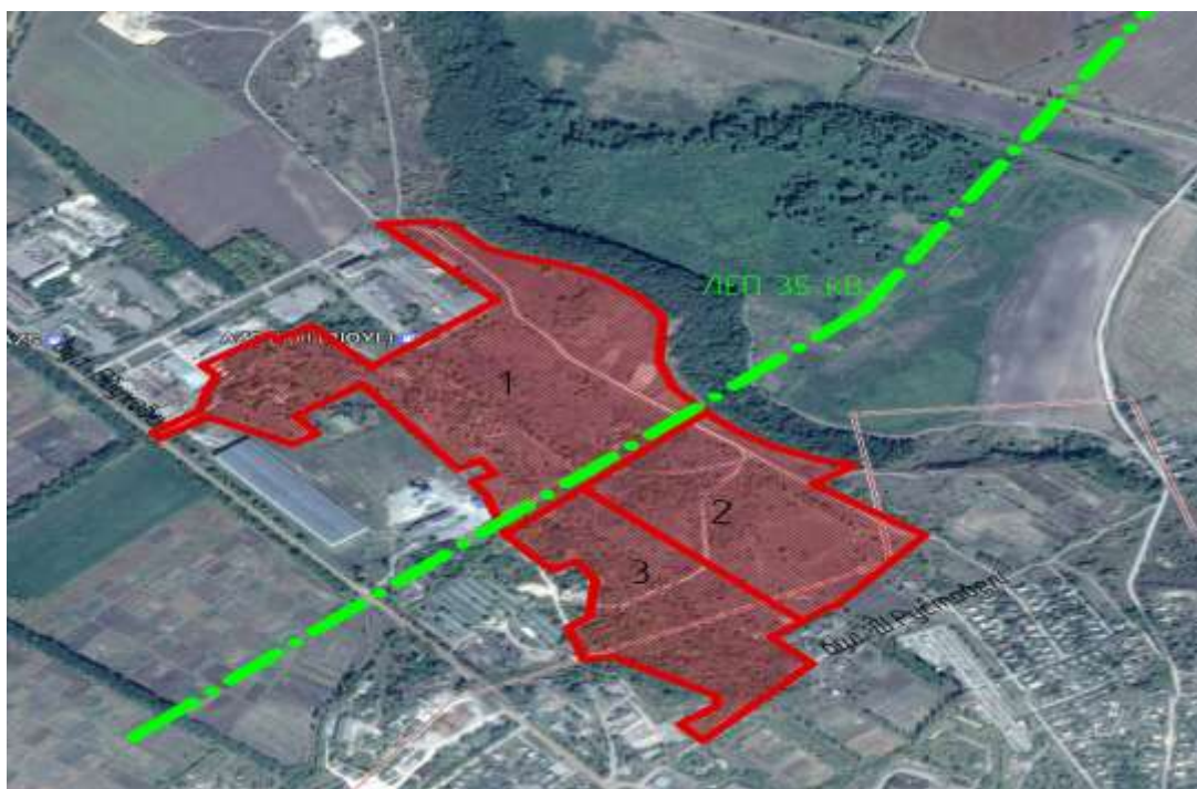
Рис. 4.7. Електропостачання

По території парку проходить ЛЕП 35 кВ, а також на відстані 200 метрів від межі ділянки розташована електростанція Північна (координати 49.688281, 32.029456), потужність якої 12,6 мВт. Резерв потужності відсутній. Для забезпечення ПП електричною енергією можливо провести реконструкцію підстанції Північна, з метою надання до неї додаткової потужності або побудувати власну.