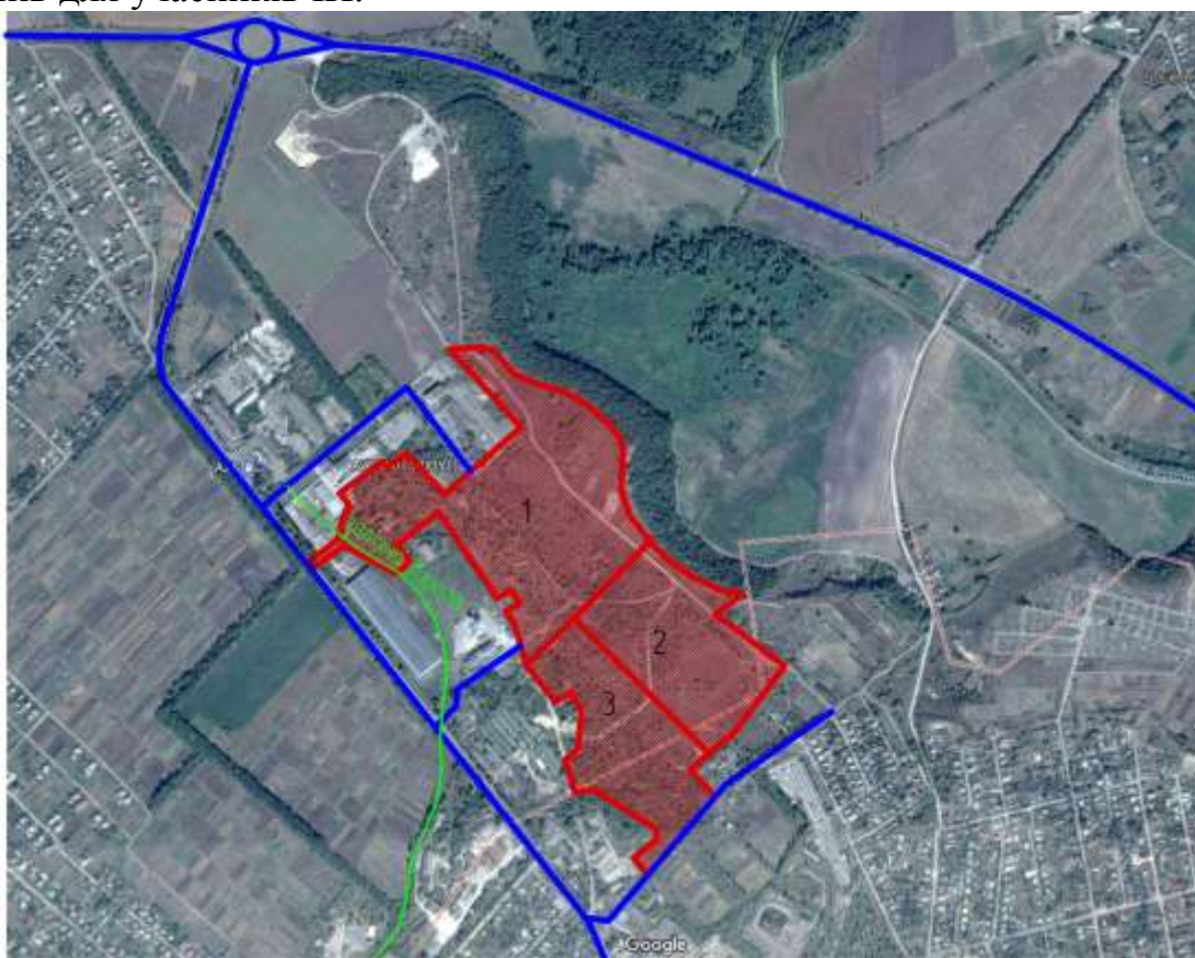
Рис. 4.5. Транспортна інфраструктура індустриально парку

Ділянка розташована на відстані 600 метрів від магістральної дороги Київ-Дніпро. Траса знаходиться у задовільному стані. Ліворуч, праворуч і посередині до ділянки підходять дороги з асфальтовим покриттям з боку вул. Обухова. Залізнична гілка заходить на земельну ділянку, найближча діюча залізнична станція „Золотоноша-1“ знаходиться на відстані близько 5 км. Також на відстані близько 5 км від території ІП знаходиться закрита у 2005 році залізнична станція „Золотоноша-2“, відкриття якої в майбутньому могло б здешевити діючі збори за подачу та забирання вагонів для учасників ІП.