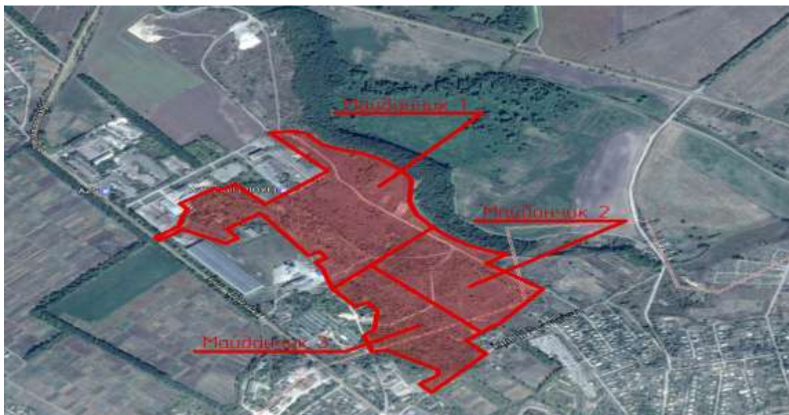
Рис. 8.1 Розподіл території парку на земельні ділянки і розміщення на них виробничо-складських об'єктів

Територію парку планується розділити на дві ділянки – промислову (майданчик 2 та майданчик 3) та аграрну (майданчик 1). Розподіл буде здійснено внутрішньо майданчиковою дорогою, по краях якої будуть прокладені необхідні для функціонування парку всі інженерно-технічні комунікації, що дає можливість вільного підключення до них всіх підприємств. Дорога забезпечить логістичні потреби учасників.