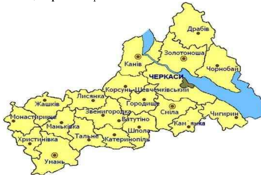
Рис. 4.2 Черкаська область, районні центри